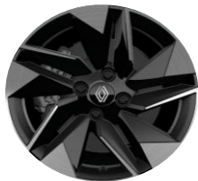
16" aluminijumski naplaci Dynamo