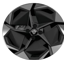
18" aluminijumski naplaci Rythmic