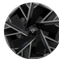
18" aluminijumski naplaci Cosmic